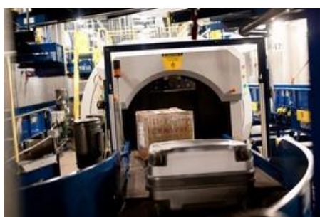
New screening machines at the San Jose airport are designed to process bags more quickly.

米運輸保安局が、サンノゼ国際空港で新型手荷物スクリーニング機器の本格的な45日間の試験を開始した。この機器は Morpho Detection 社製で、手荷物を三次元で描写する能力と危険物検出の優れたソフトウェアを備えている。(wsj.com, 8/12/200)