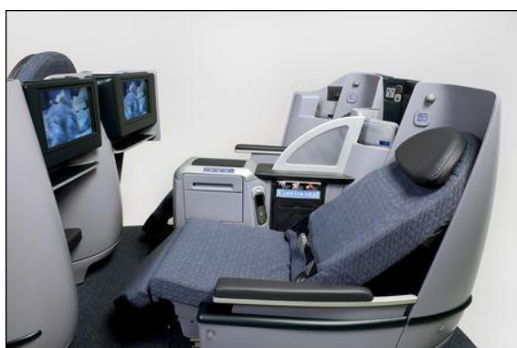
(Business First Class 座席)

CO 航空が、NBTA2010 会議と Expo で 2011 年第 3 四半期から導入する B787 型機のインテリアを発表した。 座席使用は C36 席+Y192 席で、一番機は HOU = Auckland と Lagos 線に投入する。 B787 は、炭素繊維による複合資材を使用した 強度向上と軽量化により、燃料消費を既存の航空機より▲20%減少させ航続距離を 8,200 海里に増加させる。 機内の与圧は高度 6,000 フィート（従来は 8,000）、湿度は 15%（5%）となり客室の快適性が飛躍的に向上する。 大型鞆が 4 個収納できる大型オーバーヘッドビンの他、新たに縦揺れの防止装置も設置される。 B787 は、55 の顧客から 847 機を受注している。 CO は、25 機を発注し 2011 年にその内の 6 機を受領する。(travelweekly.com, 8/09/2010)