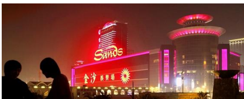
Sands China operates three large casinos in Macau, including the Sands Macao, shown above in October.

Sands China の 2009 年の利益が +22%増益の $213.8m となった。収入は +8.1%増の $3.3bn であった。Las Vegas Sands は、中止していたマカオのコータイ通りの建設工事を今月から本格的に再開する。収入規模で世界一の賭博市場となったマカオは、昨年後半から収入が大幅に増加している。12 月の賭博収入は、前年同月比 +48%増加して 114.5 億パタカ (約$1.5bn) となった。Sands China は SJM Holdings に次いでマカオで第 2 位のカジノ。昨年 11 月 30 日には香港証券取引所に上場して $3.1bn の資金を調達した。親会社の Las Vegas Sands は、2009 年の決算で▲$540.1m の欠損を計上した。2008 年の▲$188.8m より欠損が拡大している。ライバル企業の Wynn Macau は、2009 年の利益が 2009 年 9 月に予想したよりも +41%の増益となると言っている。(wsj.com, 3/02/2010)