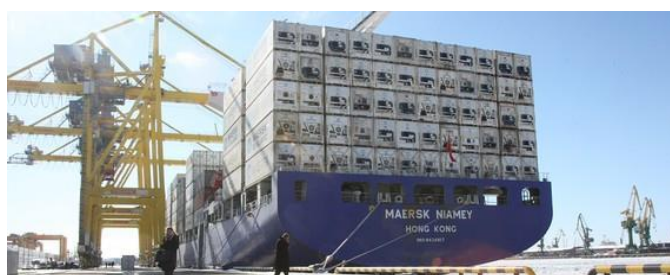
A Maersk cargo transshipment vessel stoof at the port in St. Petersburg, Russia, in March 2010.

世界最大のコンテナ海運 A.P. Moller-Maersk A/S（デンマーク）の今年度の利益が、貨物レート、燃油、為替の変動が安定するという条件で、2008 年の $3.5bn を超える見通しだ。2009 年には▲$1.31bn の欠損を計上した。(wsj.com, 7/08/2010)