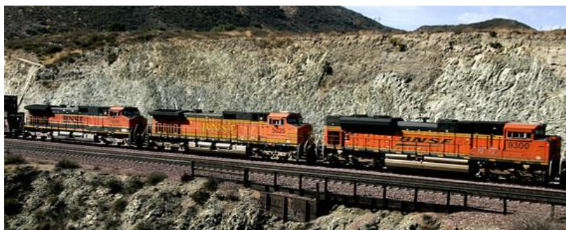
A Burlington Northern Santa Fe train moves through Cajon Pass near San Bernardino, Calif.