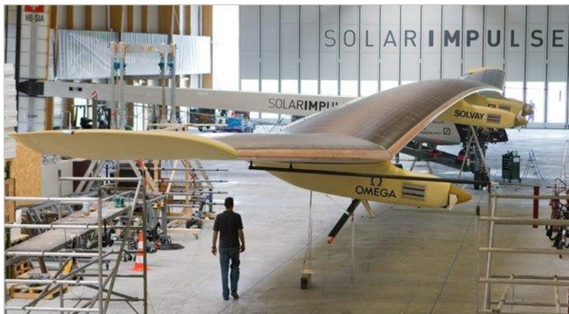
The Solar Impulse HB-SIA in Payerne, Switzerland.

巨大な翼で太陽発電する航空機が開発されている。Solar Impulse 実験機は、翼上に12,000個の太陽電池を備えている。先週、昼間に高度8,500mまで上昇し、夜間飛行を可能にするために充電してから徐々に降下する初飛行を実施する予定であったが、スイスの飛行モニター機器の不具合でこの試験は延期された。(nytimes.com, 7/04/2010)